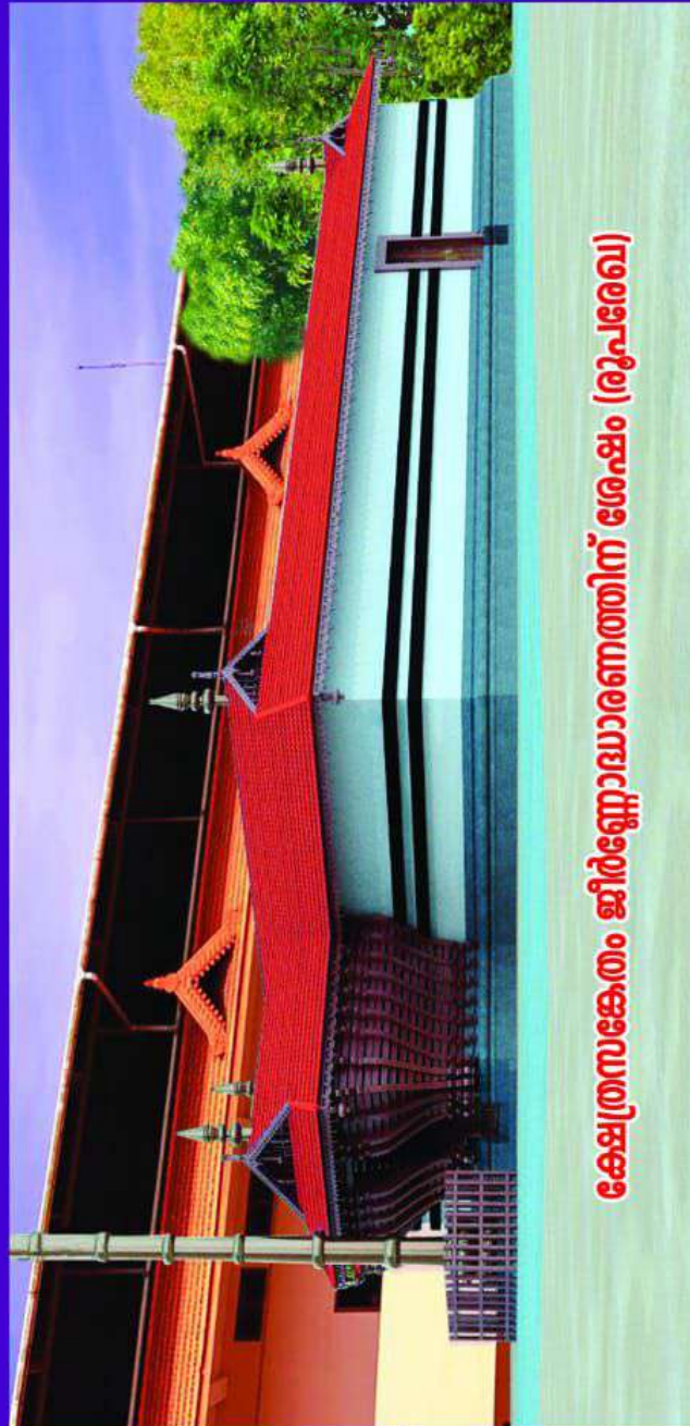
ക്ഷേത്രസങ്കേതം ജീർണ്ണോദ്ധാരണത്തിന് ശേഷം (രൂപരേഖ)